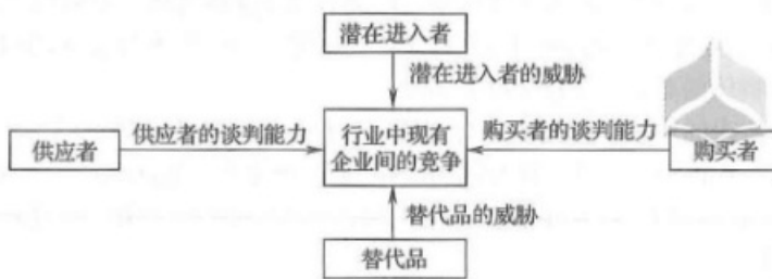
图 1-5 波特“五力模型”图

解析：美国著名战略管理学家迈克尔·波特教授提出的“五力模型”分析法是分析行业结构的重要工具。在一个行业里，普遍存在着五种基本竞争力量，即潜在进入者的威胁（选项E）、行业中现有企业间的竞争、替代品的威胁（选项D）、供应者的谈判能力（选项B）和购买者的谈判能力（选项C）。综上所述，本题应选择BCDE选项。