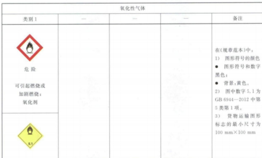
表 B.1 氧化性气体标签要素的分配